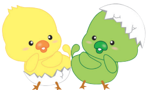
JAグリーン近江キャラクター